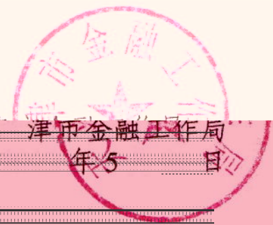
天津市金融工作局