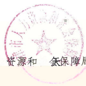
天津市人力 社 资源和 会保障局