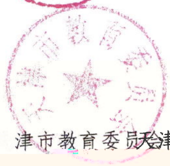
天津市教育委员会